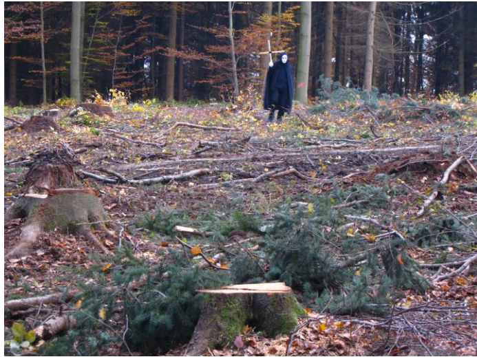
... für den Klima- und Umweltschutz abgeholzt und für ein Windindustriegebiet in seiner ökologischen Funktion zerstört.